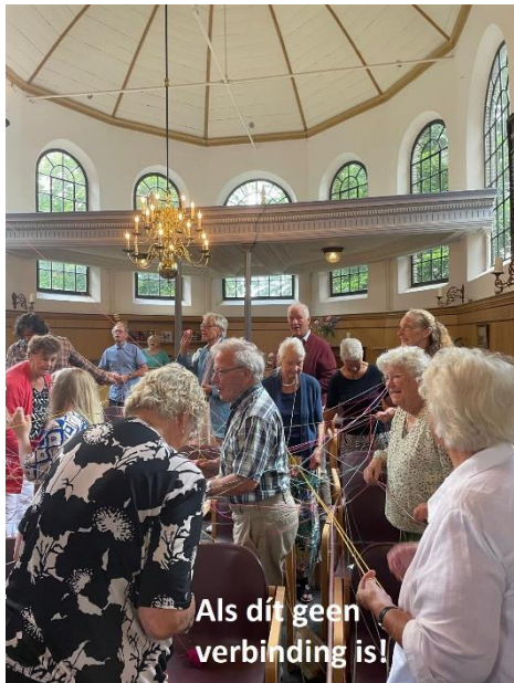
Als dit geen verbinding is!