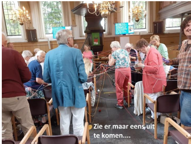
Zie er maar eens uit te komen....