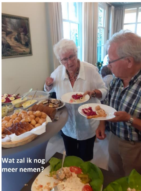
Wat zal ik nog meer nemen?